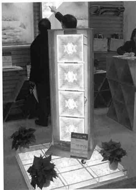
タテヤマアドバンスは、LEDバックライト式照明ユニット「アドバンスライト」を紹介した