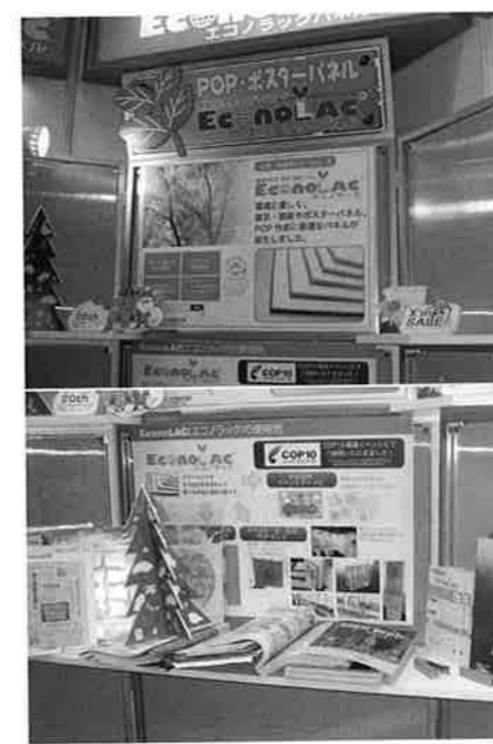
ベルアドワイズは環境対応型低発泡スチレンパネル「EconoLAC」を紹介した