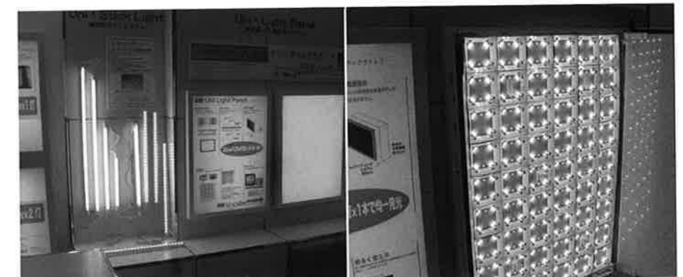
用途や予算によって蛍光管とLEDを使い合わせる「esライティングシステム」や「ユニ・スティックライト」を提案した彩ユニオン