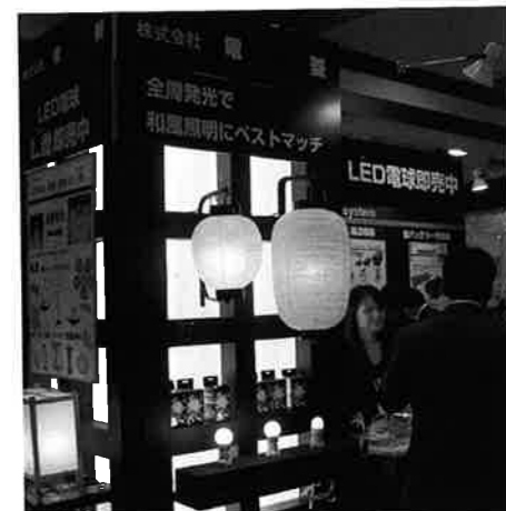
電燈はLED電球「L魂（えるだま）」等を紹介した