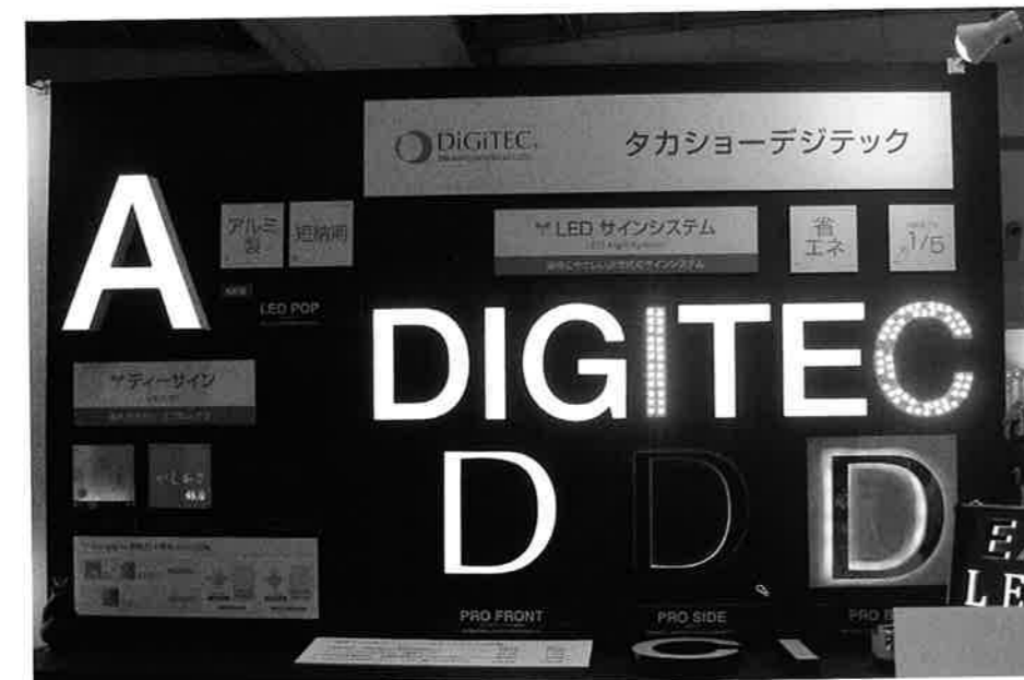
タカショーデジテックの「LED POP」はLED光源のチャンネル文字。同社の従来品よりも低価格で、これまでとは違う客層も販売対象としている