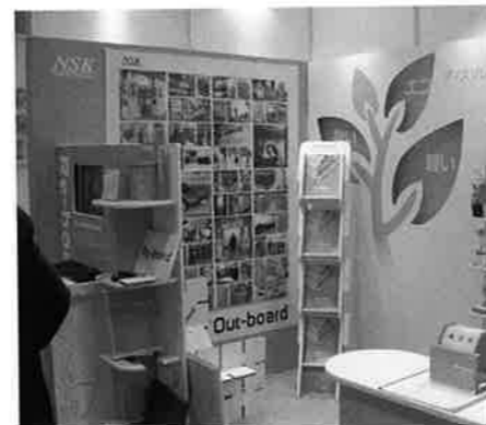
日本製図器工業はリサイクル可能なエコ資材「Re-board」を使ったディスプレイを提案した