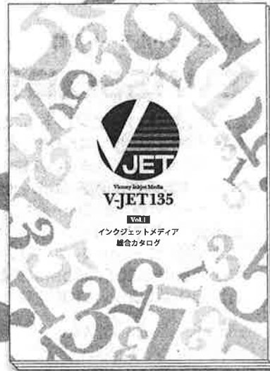
インクジェットメディア総合カタログ 「V-JET135 vol.1」