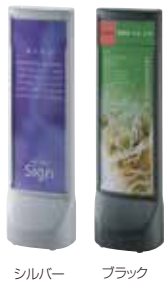
シルバー ブラック